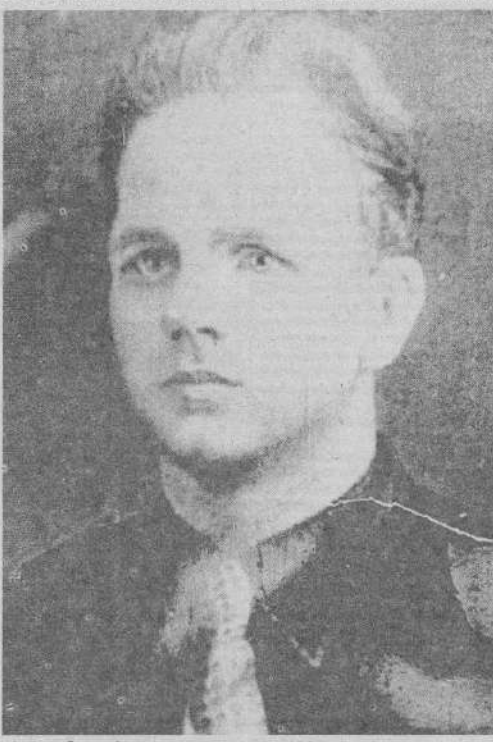
Ф.Я. Бабкин. Фотокопия с рисунка 1990 г.

или меньше приходит и говорит: — Давай, бае (на их языке означает богатый человек или начальник), разговаривать. — О чем? — А вот кто пойдет оленя ловить, который убежал? чение продуктовыми и промышленными товарами, влияние богатой прослойки и шаманов на бедные слои коренных народностей, взаиморастаивание с русским народом при строи-